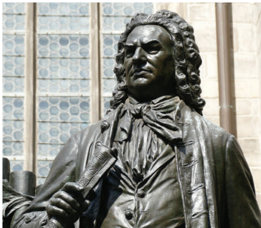
Bronze-Statue von Johann Sebastian Bach in Leipzig

Leipzigs Bevölkerung ist seit 2010 jährlich im Schnitt um 2% gewachsen. Zwischen 2012 und 2014 war sie sogar die am stärksten wachsende Großstadt Deutschlands. Die tatsächliche Entwicklung übertraf jegliche Prognosen. Erklärt wird das starke Wachstum mit dem Zuzug junger Menschen der Arbeit wegen, bei neuen großen Arbeitgebern und dem Geburtenüberschuss 2013 und 2014. Im Jahr 2015 nahm die Bevölkerungszahl um fast 16.000 und im Jahr 2016 um 10.000 Einwohner zu. Daraus resultierend besteht ein starker Bedarf an Wohnraum.